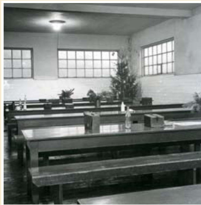
Den enda bevarade bilden inifrån Koppargrytan före ombyggnaden i slutet på 50-talet.