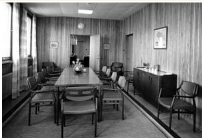
Interiör från nya huvudkontorets gäst matsal ca 1955.